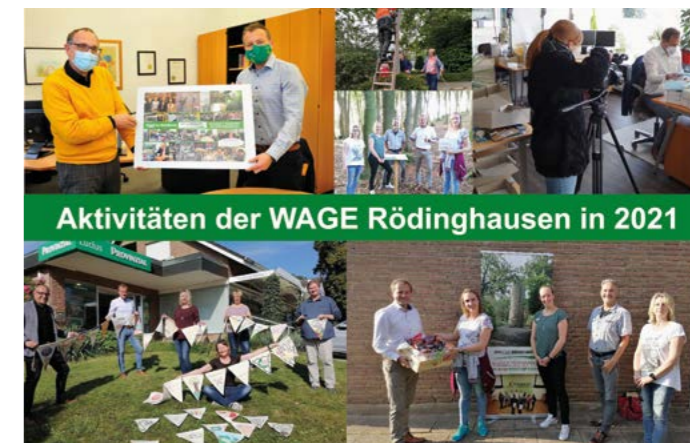
Aktivitäten der WAGE Rödینگhausen in 2021