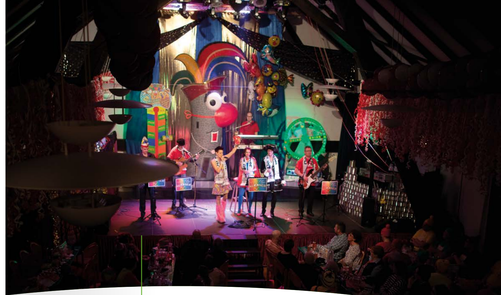
Ein Bild aus vergangenen Jahren. Ende Mai soll es im Haus des Gastes wieder so bunt zugehen.