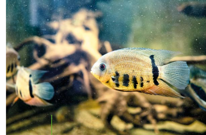
Auch diese seltenen Buntbarsche fühlen sich sichtlich wohl in Rödinghausen.

Ein paar Meter weiter schwimmen weitere Buntbarsche in 8.000 Litern Wasser – eine Größenordnung, an die viele Zooaquarien nicht heranreichen. „Früher standen hier viele kleine Becken, als wir noch eine Zuchtanlage betrieben haben“, erzählt der 68-Jährige. Doch die erforderte immer mehr Zeit und Aufmerksamkeit und so entschied sich das Ehepaar, etwas kürzer zu treten. Gemeinsam mit Freunden wurde so das riesige Becken selbst gebaut, wurden Leitungen verlegt und für Luftzirkulation rund um das Aquarium gesorgt. Immer weiter reiste Harald Kahden nach Südamerika, fing und fotografierte Fische, studierte ihren Lebensraum, ehe er ihn nun detailgetreu nachbildete. Die größte Herausforderung war dabei die Wasserqualität. „Das Leitungswasser hier in Rödinghausen ist viel zu hart, das kann ich kaum nutzen“, erklärt Harald Kahden und setzt so viel lieber auf Regenwasser und eine besondere Art der Aufbereitung.